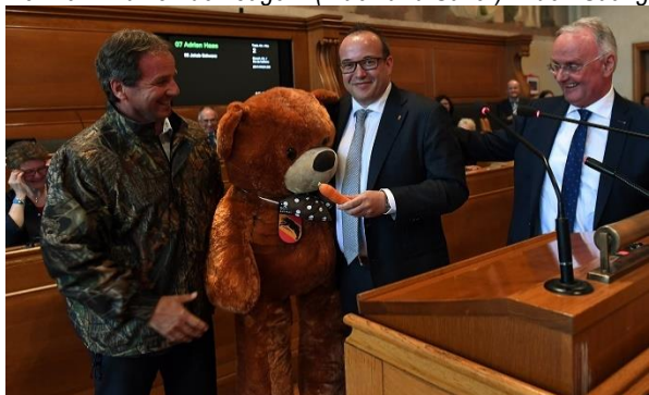
Der arme Bär hat Hunger