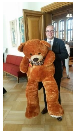
Bärenfan mit Bär