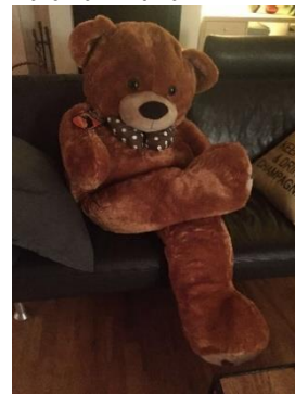
Zufrieden bei Carlos Zuhause